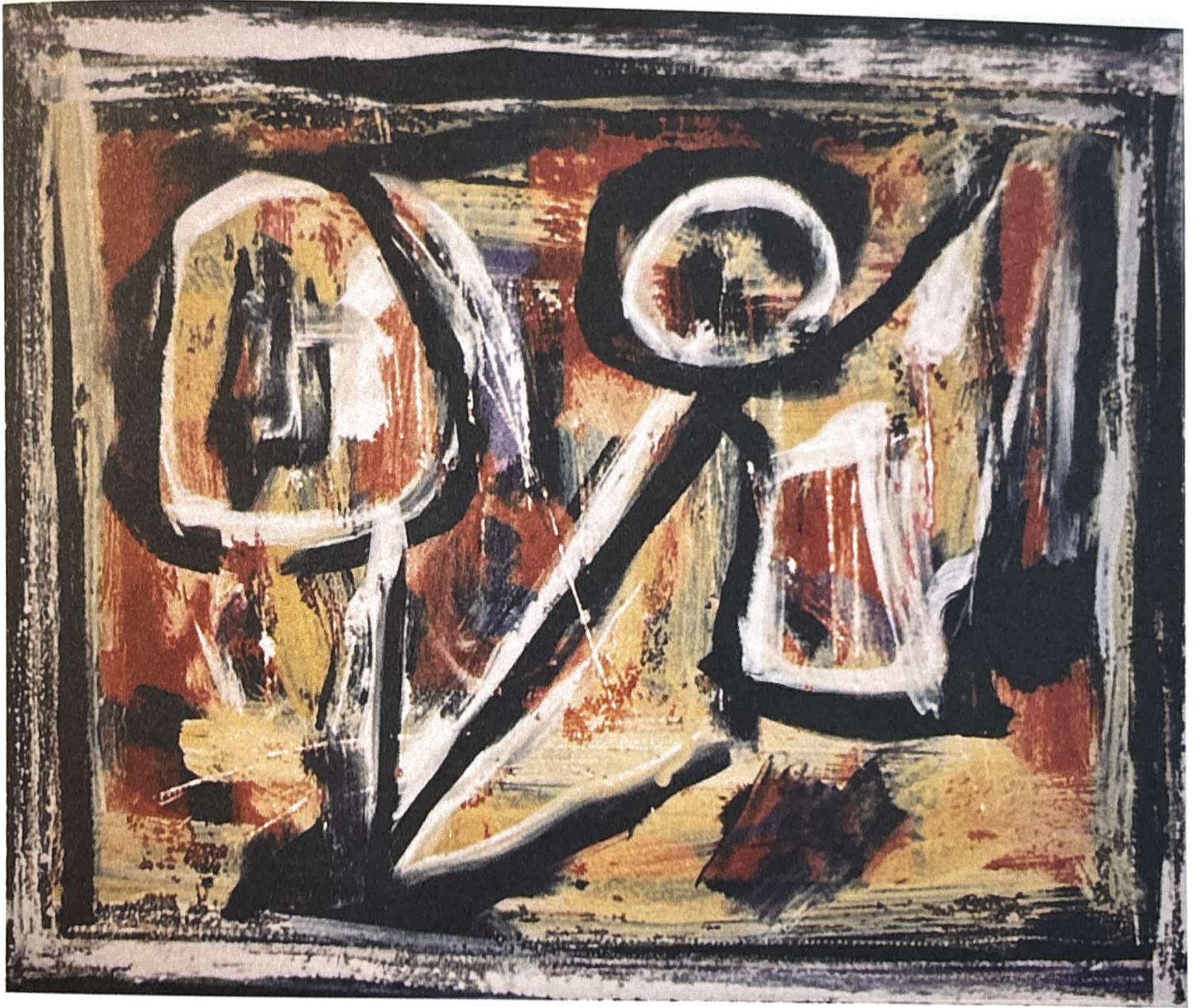
Robert PINGET, série : EMAUX (40 cm x 32 cm), collection de l'artiste.