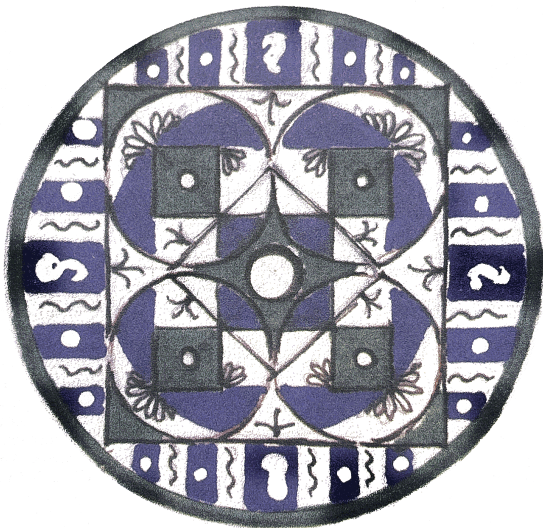
Robert PINGET, « Mandala II » (Archives R. Pinget).